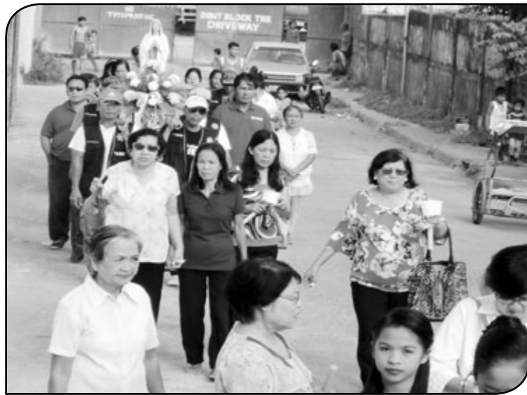
CANDLE LIGHT (February 24 to March 02, 2013)