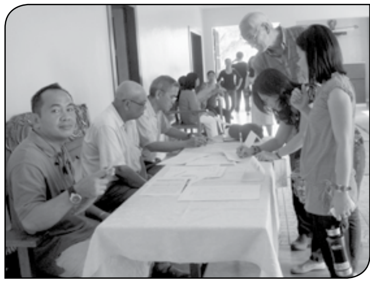
PPCRV.... from page 1