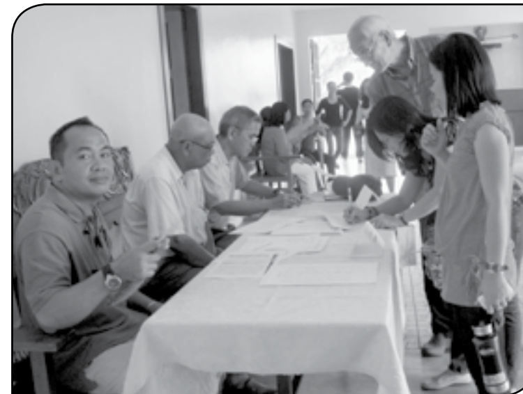
PPCRV.... from page 1

Wala sing tulumanon liturhiko nga nagamando sa aton sa pagkanta sa ambahanon sa pagtapos . Apang ginapa-kamaayo nga samtang nagagwa ang mga sumilimba sa simbahan sila nagakanta sang pagdayaw sa Dios. Sa sini nga bahin samtang nagapagwa ang mga tawo ang koro padayon nga nagakanta. 🙏